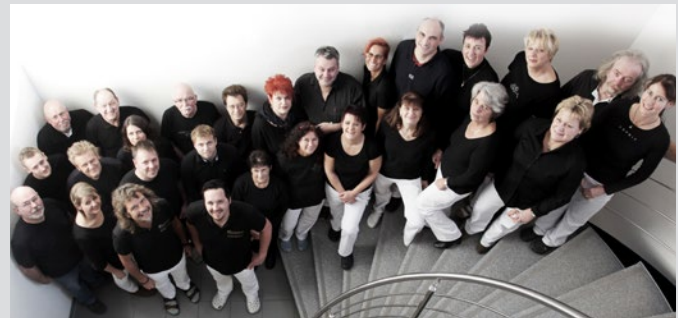
Sachkundig, engagiert und hochmotiviert: das Laborteam der Rüdiger Bolkart Dental-Technik GmbH.