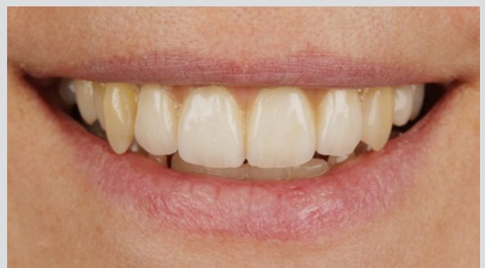
Finale Frontrestauration von 12 bis 22.

Julian Bolkart: Die Entwicklung bringt immer bessere Kunststoffe und Komposite hervor. Da werden sich interessante Gebiete ergeben, wie z. B. bei dem Werkstoff PEEK.